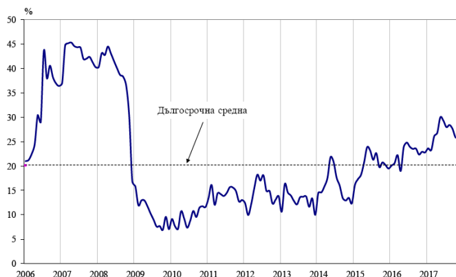
Фиг. 1. Бизнес климат - общо

По данни на Националния статистически институт през декември 2017 г. общият показател на бизнес климата се понижава с 1.6 пункта спрямо ноември 2017 г. Понеприятен бизнес климат е регистриран в промишлеността, строителството и сектора на услугите, докато в търговията на дребно запазва приблизително равнището си от предходния месец.